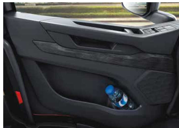
Das Türablagefach bietet Platz für eine 1,5-Liter-Flasche.

Der Schlafbereich ist symmetrisch angelegt und garantiert unvergleichlichen Komfort. Hart oder weich – bei der einteiligen Liege haben Sie die Wahl zwischen zwei Matratzenstärken. Sie benötigen eine Gepäckablage oder ein weiteres Bett? Wählen Sie zwischen den Optionen Smart und Comfort für eine Ausstattung nach Ihren Bedürfnissen.