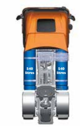
LNG – bis zu 1.600 km

Die Tanks sind in CNG-, LNG- oder C-LNG-Ausführung erhältlich und individuell anpassbar, sodass Sie genau den Freiraum haben, den die Komponenten für Ihre Mission brauchen – mit einer Kraftstoffautonomie von bis zu 1.600 km.