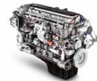
Cursor 13 NP