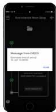
IVECO Assistance Non-Stop