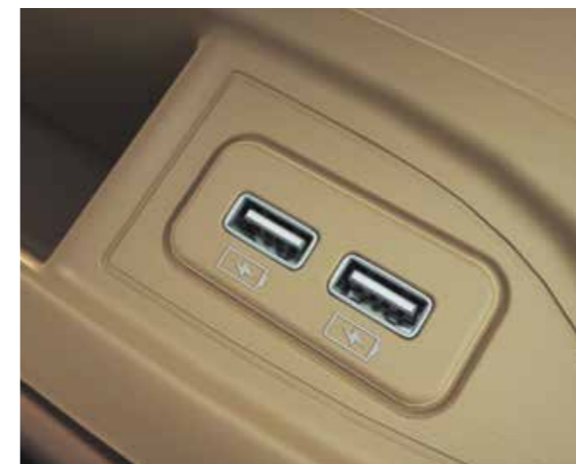
Damit Sie immer voll aufgeladen sind: Zwei USB-Anschlüsse befinden sich an den oberen Fächern jeder Wand.