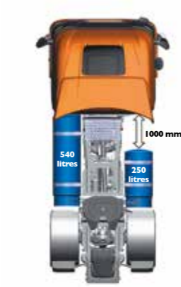
LNG – bis zu 1.150 km