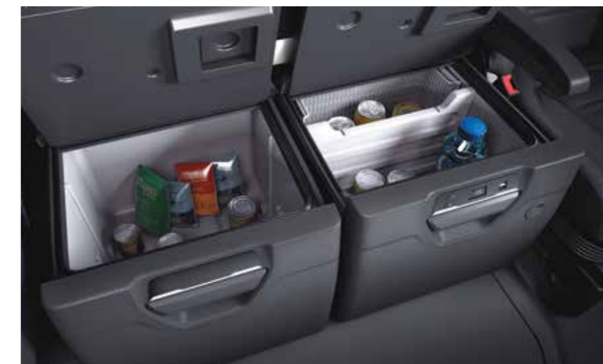
Große Auswahl an Kühlbox- und Kühlschranks-Kombinationen mit bis zu 100 Litern Gesamtfassungsvermögen – auch erhältlich mit Gefrierfach.