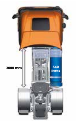
LNG – bis zu 800 km