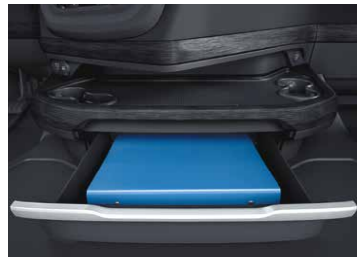
Die untere Konsole eignet sich perfekt für DIN-A4-Ordner.